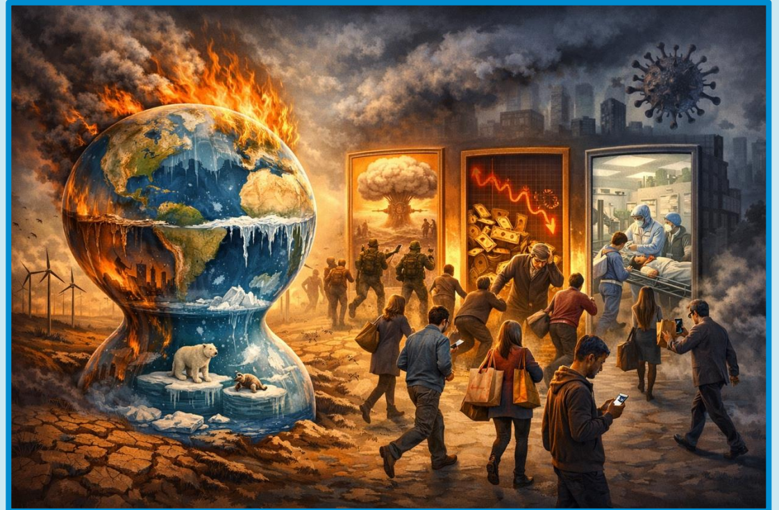
OpenAI (2026): Digitale Illustration zur Visualisierung der konkurrierenden Krisen im Kontext der Klimakrise [KI-generiertes Bild]. DALL-E.

Politische Durchsetzbarkeit und Druckmechanismus als Herausforderung (Neodirigismus)