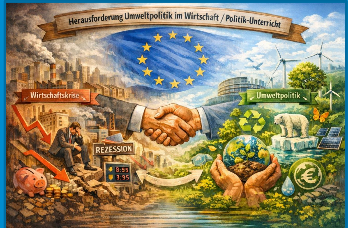
OpenAI (2026): KI-generierte Illustration zur Unterrichtseinheit „Umweltpolitik in der (Wirtschafts-) Krise ...“. Erstellt mit DALL-E am 03.03.2026.

Tauschen Sie sich zum Zusammenhang zwischen Wirtschaftskrise und Klimapolitik aus.